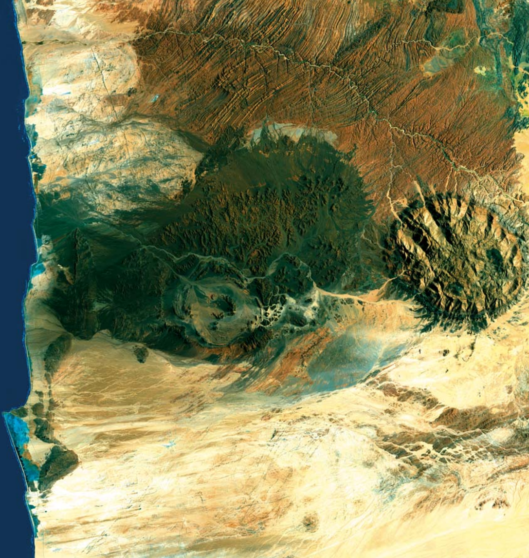
Farbenspiel von Wüste und Meer – Küstenabschnitt der Namib mit Brandbergmassiv